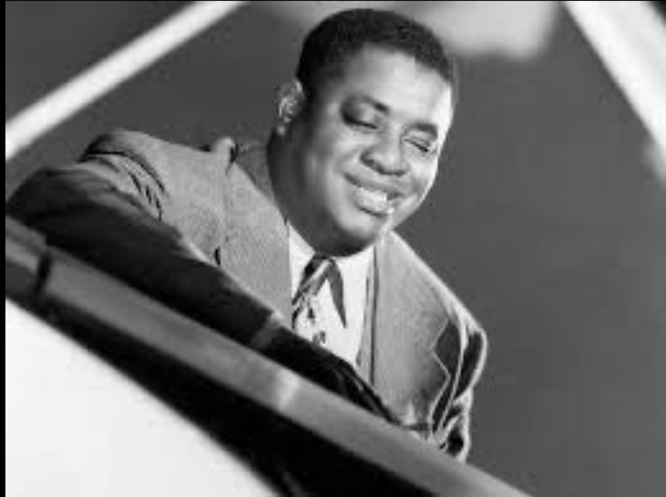
Art Tatum (1909/1956)