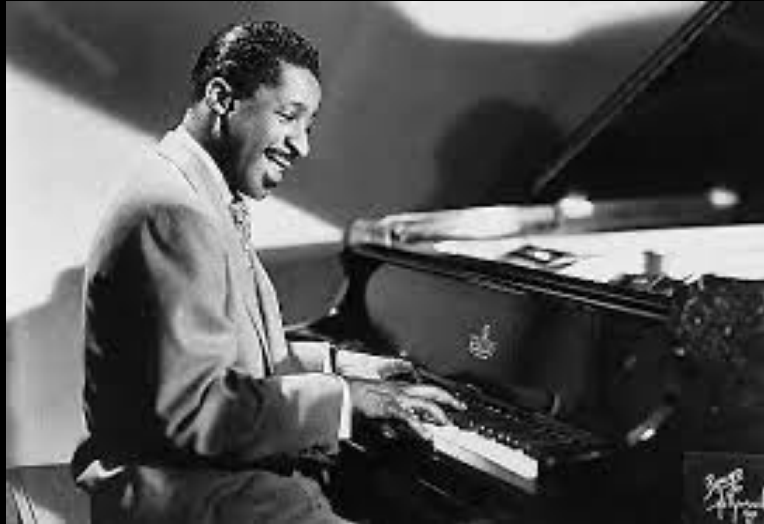
Errol Garner (1921/1977)