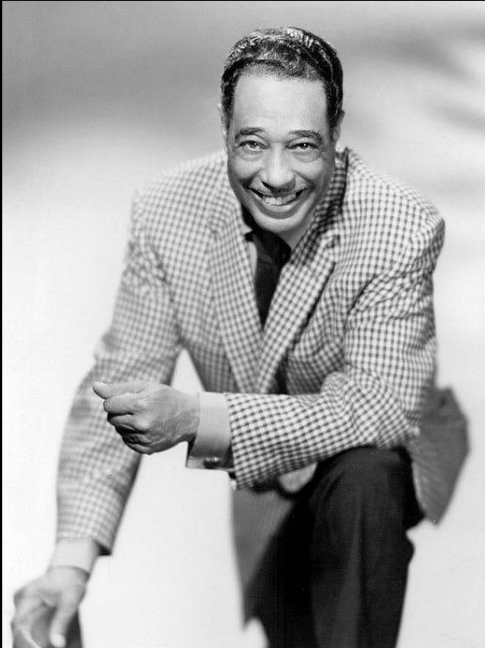
Duke Ellington (1899/1972)