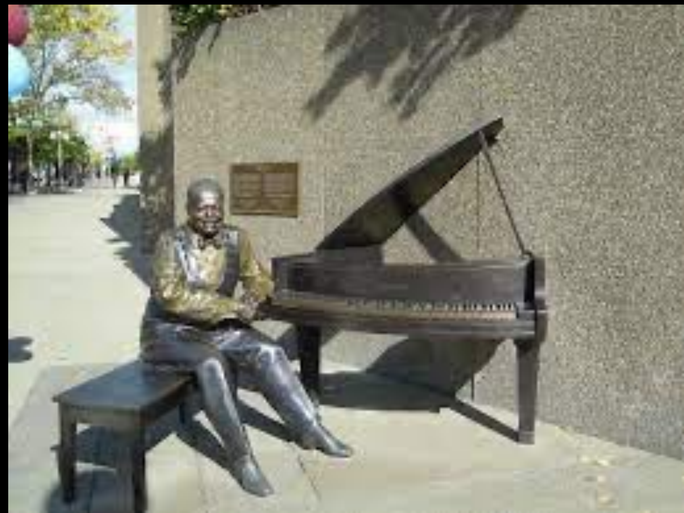
Statue de Peterson à Ottawa