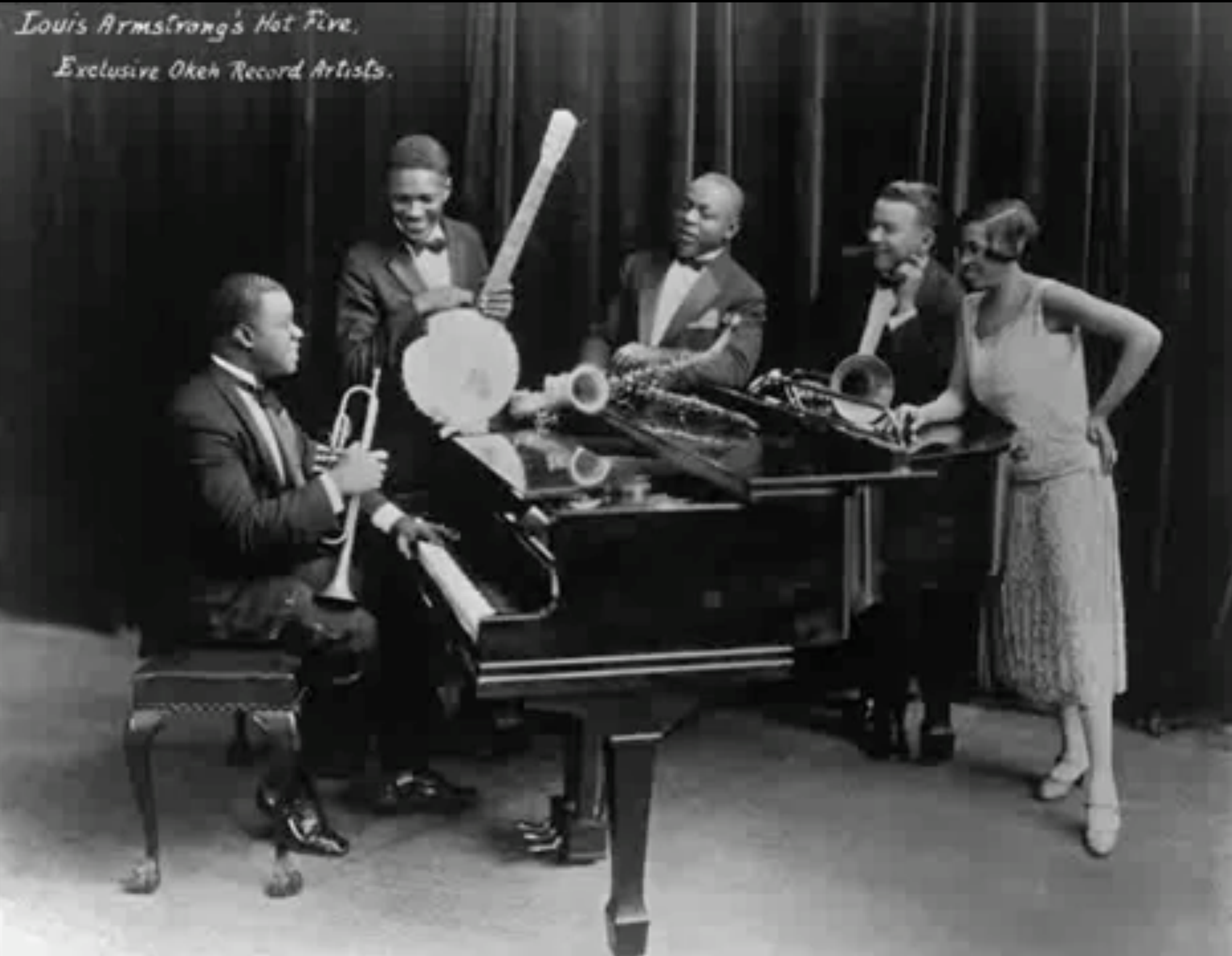
1926 : Lonesome Blues.