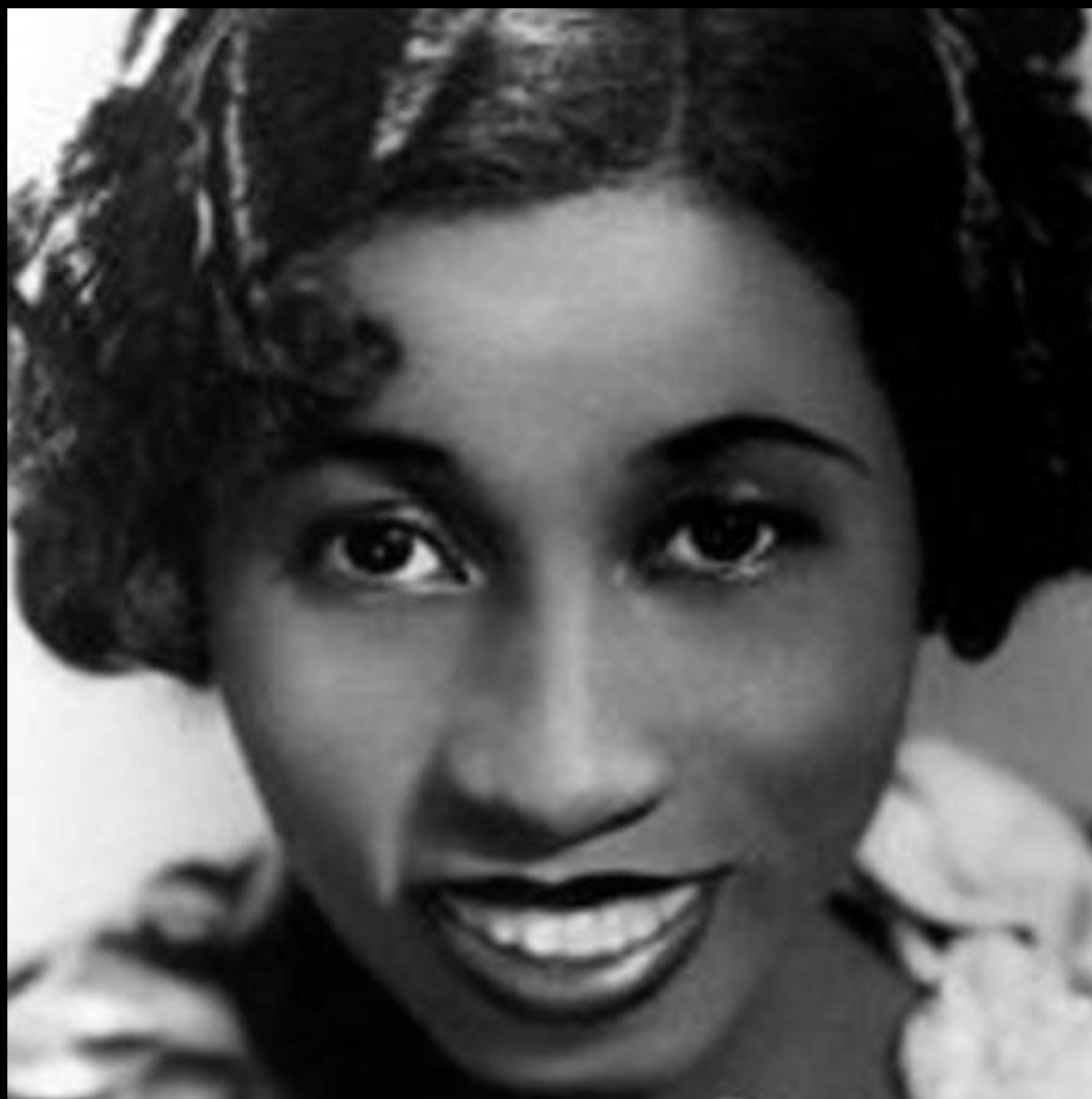
Lil Hardin Armstrong