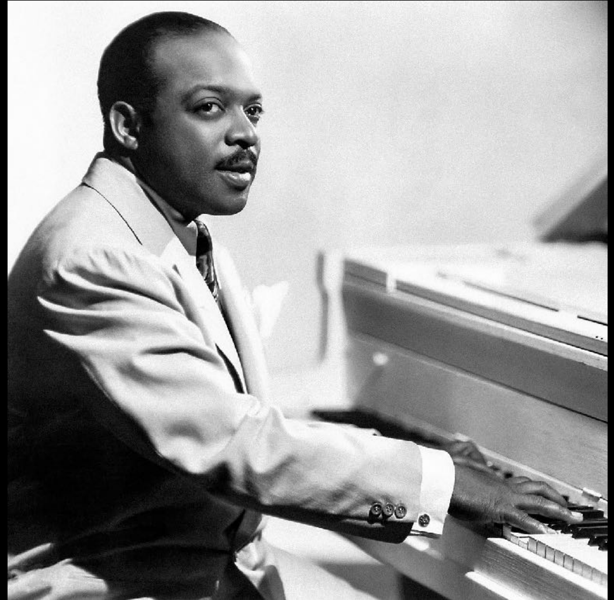
Count Basie (1904/1984)